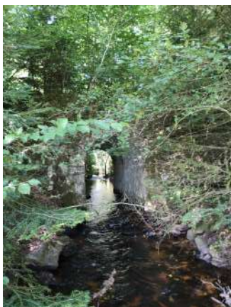
Pont de l'ancienne digue d'étang sur le ruisseau d'Alesmes.

12 Suivre le virage à droite. Continuer encore 100 m jusqu'à retrouver le bitume sous vos pieds et tourner à gauche jusqu'à la RD 13 qui traverse Champnétery. Tourner à droite et longer la route principale avec prudence sur 400 m avant de tourner à gauche pour revenir au point de départ.