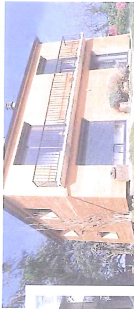
Maison avant et après rénovation